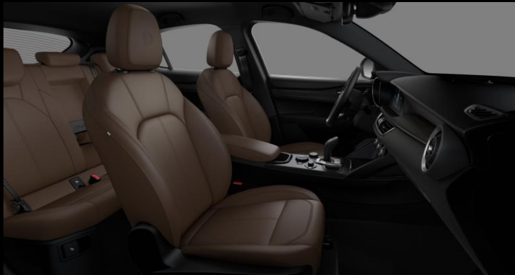
556 – Ruskea Nahkaverhoilu