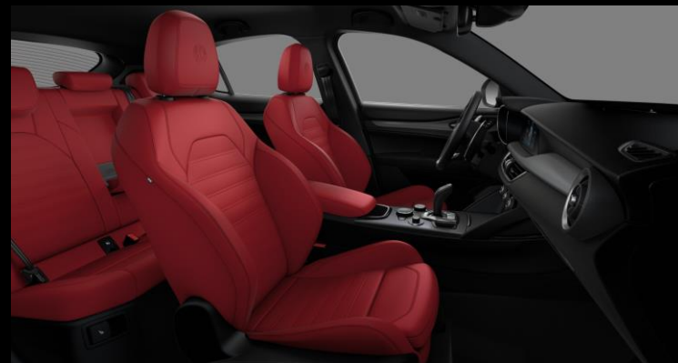
557 – Punainen nahkaverhoilu. Sport-istuimet