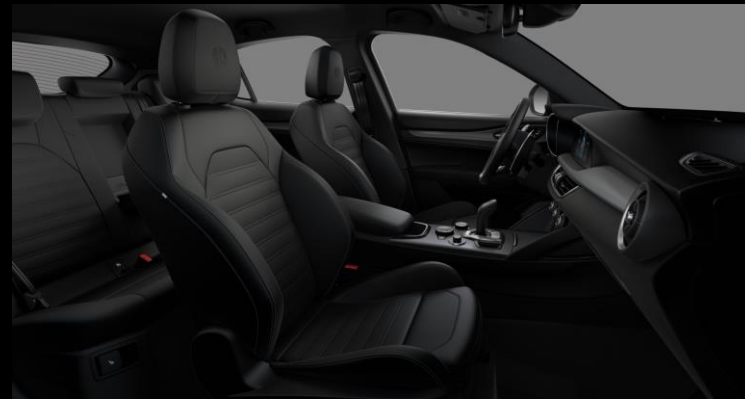
423 – Musta nahkaverhoilu. Sport-istuimet