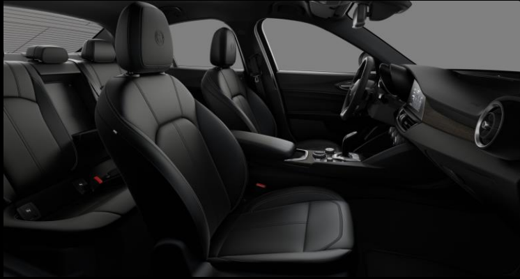
433 – Musta nahkaverhoilu