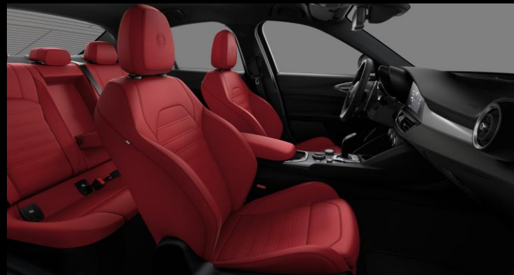
557 – Punainen nahkaverhoilu. Sport-istuimet