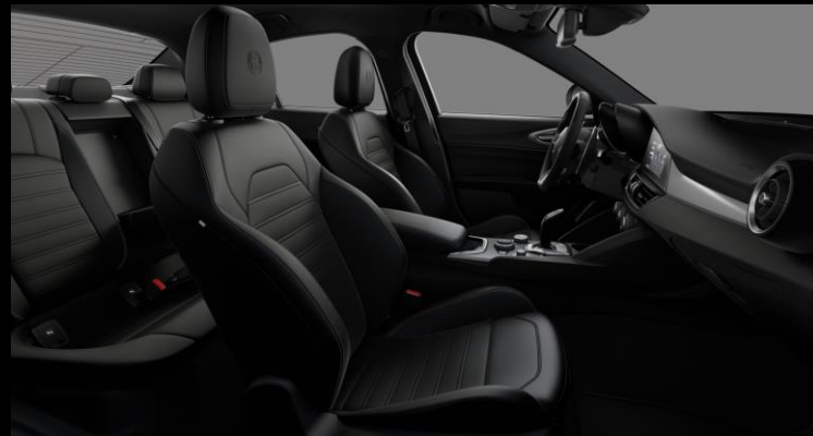
473 – Musta nahkaverhoilu. Sport-istuimet