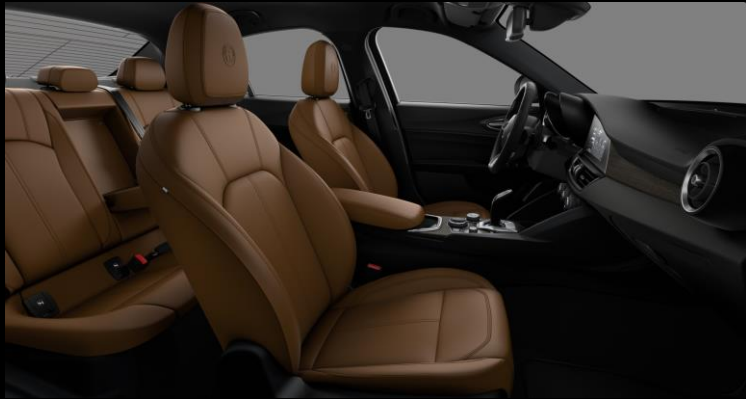
556 – Ruskea Nahkaverhoilu