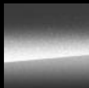
035 – Vesuvio Grey* Varastoväri

Autoveroton Svh 1030 € Autovero 119,07 € Kokonaishinta alkaen 1149,07 €*