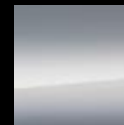
252/B - Moonlight Grey

Autoveroton Svh 1030 € Autovero 119,07 € Kokonaishinta alkaen 1149,07 €*