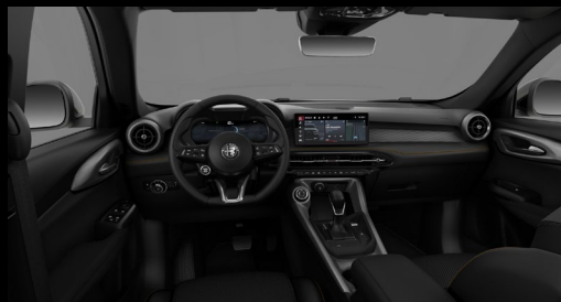
Ti Business | 047