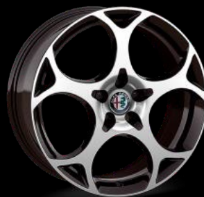
19" kevytmetallivanne 8.0 x 19 "Diamond Cut" Rengaskoko 235/45 R19 1MM | Lisävaruste