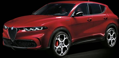
414 | Alfa Red