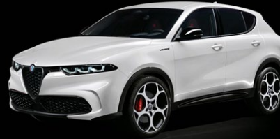
240 | Alfa White