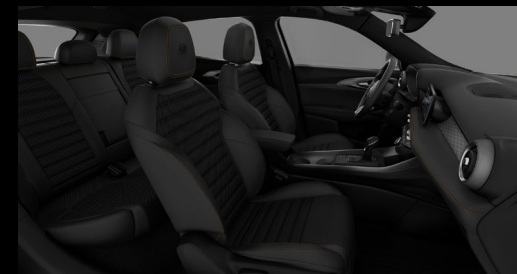
Veloce Business | 027