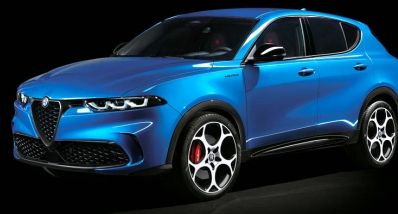
756 | Misano Blue