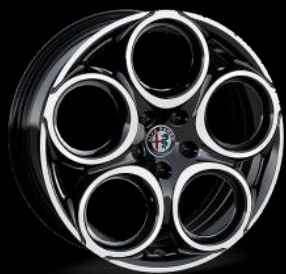
18" kevytmetallivanne 7.5 x 18 "Diamond Cut" Rengaskoko 235/50 R18 WBR | Vakio