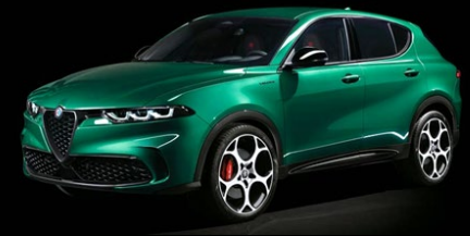
398 | Montreal Green