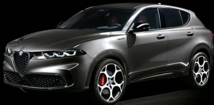
581 | Vesuvio Grey