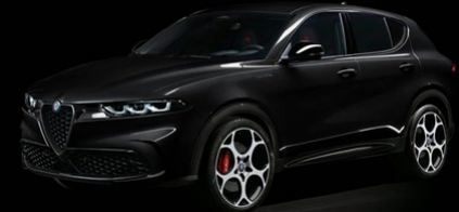
601 | Alfa Black