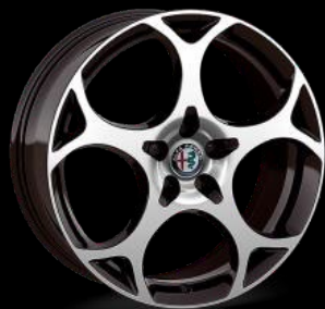
19" kevytmetallivanne 8.0 x 19 "Diamond Cut" Rengaskoko 235/45 R19 1MM | Vakio