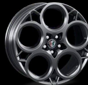
20" kevytmetallivanne 8.0 x 20 "Diamond Cut" Rengaskoko 235/40 R20 1M4 | Lisävaruste