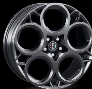
20" kevytmetallivanne 8.0 x 20 "Diamond Cut" Rengaskoko 235/40 R20 1M4 | Lisävaruste